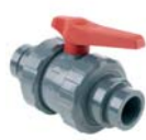
Netvitc Kugelhahn System RAN