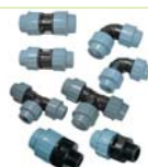
Klemmverbinder für PE-Rohr und PVC-Spiralschlauch

Serie 355.xxx.xxxx Art.Nr. siehe Preisliste