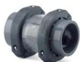
Rückschlagklappe PVC-Klebemuffe Schauglas, transparent

Zur Festlegung der Durchflussrichtung Zur Funktions- und Durchflusskontrolle mit Schauglas erhältlich.