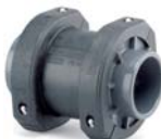
Rückschlagklappe PVC-Klebemuffe opak