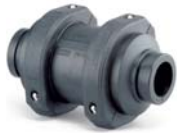
Rückschlagklappe System RAN opak