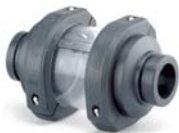
Rückschlagklappe System RAN Schauglas, transparent